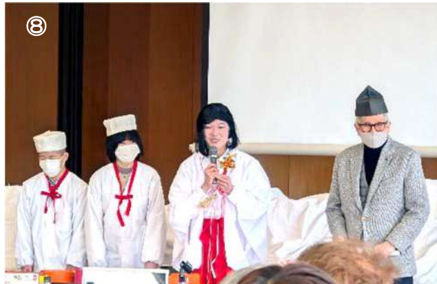
⑧豊験あらたか(怪しげ?)な神主と巫女!