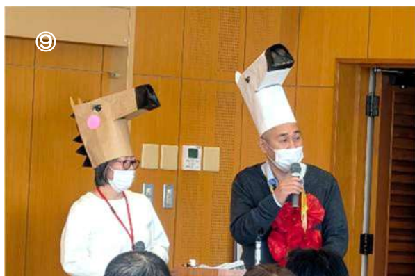
⑨午年のクイズ大会の司会は イケダイナパクト&シロタマキバオー!