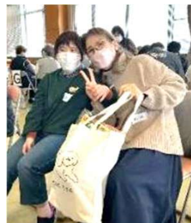
クイズ大会の景品、気に入りましたか~?